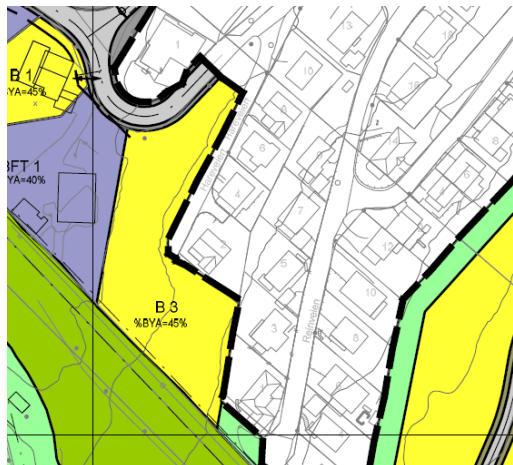
Figur 1: Utsnitt områdeplan, felt B3

Begge feltene er avsatt til bolig i Områdeplan for Fagernesfjellet.