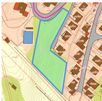
Figur 3: foreløpig planavgrensning, felt B3

Foreløpig planavgrensning er vist på figurene under: