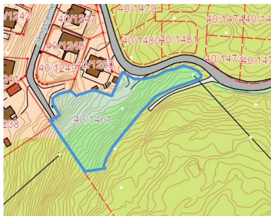
Figur 4: Foreløpig planavgrensning, felt B6