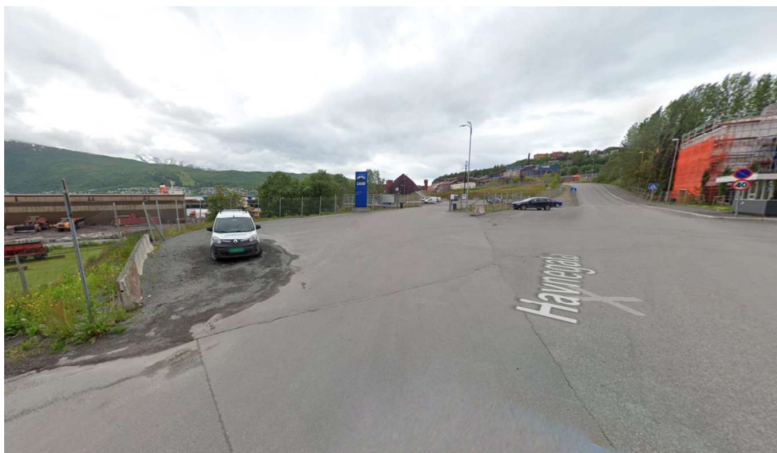
Figur 2: skjermfoto som viser eksisterende avkjørsel til LKAB Norge AS sine virksomheter.

Det er derfor ikke snakk om arealer som skal få helt ny bruk, men om en utvidelse av eksisterende trafikk- og service-arealer, for å få en tryggere trafikksituasjon omkring inn- og utkjøring fra LKAB sitt industriområde. Utvidelsen av trafikkarealet vil gå noe på bekostning av eksisterende friareal. Det er planlagt tiltak med støttemur for å redusere inngrepet.