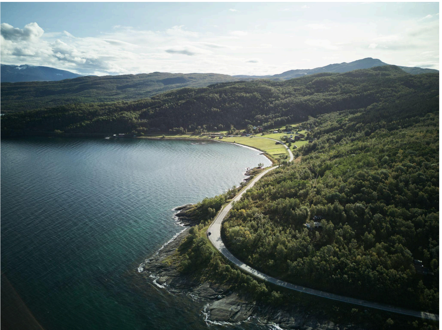
Landbrukets kulturlandskap, Punsvika i Ballangen