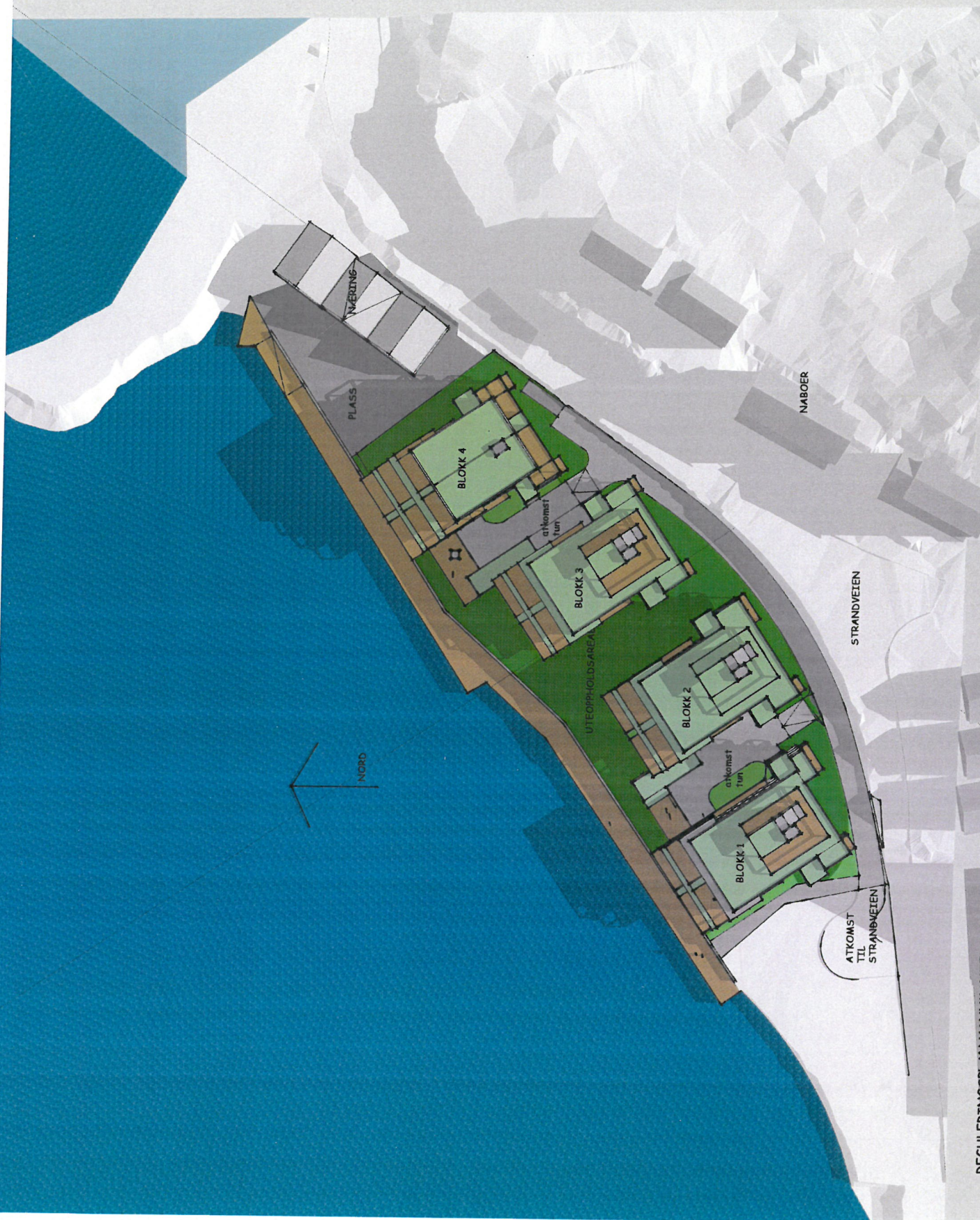
REGULERINGSPÅN VANNKANTEN NARVIK KOMUNE - ILLUSTRASJON - SOL OG SKYGGEDIAGRAM - 22. MARS OG 22. SEPTEMBER KL 12 - ARKITEKT JIM MYRSTAD AS - 7.3.2016