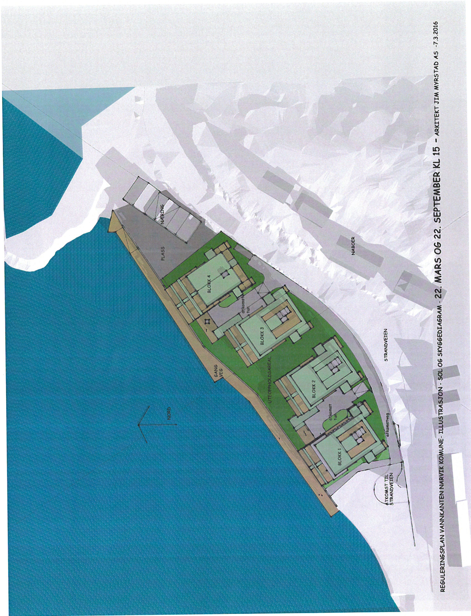
REGULERINGSPLAN VANINKANTEN NARVIK KOMUNE - ILLUSTRASJON - SOL OG SKYGGEDIAGRAM - 22. MARS OG 22. SEPTEMBER KL 15 - ARKITEKT JIM MYRSTAD AS - 7.3.2016