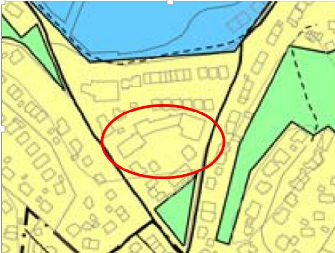
Figur 1: Utsnitt kommuneplanens arealdel 2017-2028.

Eiendommene er avsatt til bolig i kommuneplanens arealdel.