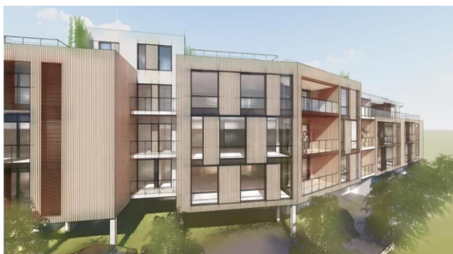
Figur 1: Fasade nordøst

Som et utgangspunkt ønskes det tilrettelagt for inntil 3 etasjer og 1 tilbaketrukket etasje på del av tomta mot øst, samt 2 etasje og 1 tilbaketrukket etasje på del av tomta mot vest. Parkering etableres på plan 1/bakkeplan.