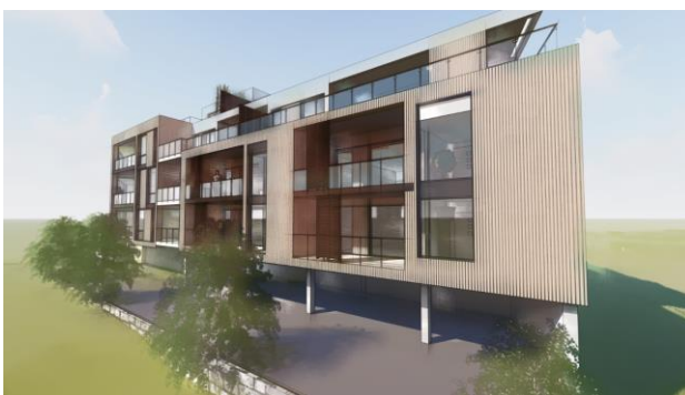
Figur 2: Fasade nordvest

Dagens atkomst fra Sjøveien beholdes. Det vil blant annet bli redegjort for endret trafikk til og fra eiendommen. Dagens virksomheter i planområdet generere trafikk både i form av ansatte som kjører til/fra jobb og inn til lunch, kunder, trafikk til og fra karosseriverksted, samt vareleveranser.