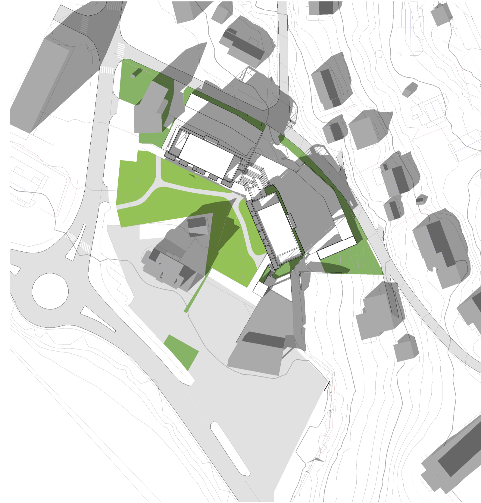
A10_03 - Skyggestudier 01.03. kl15