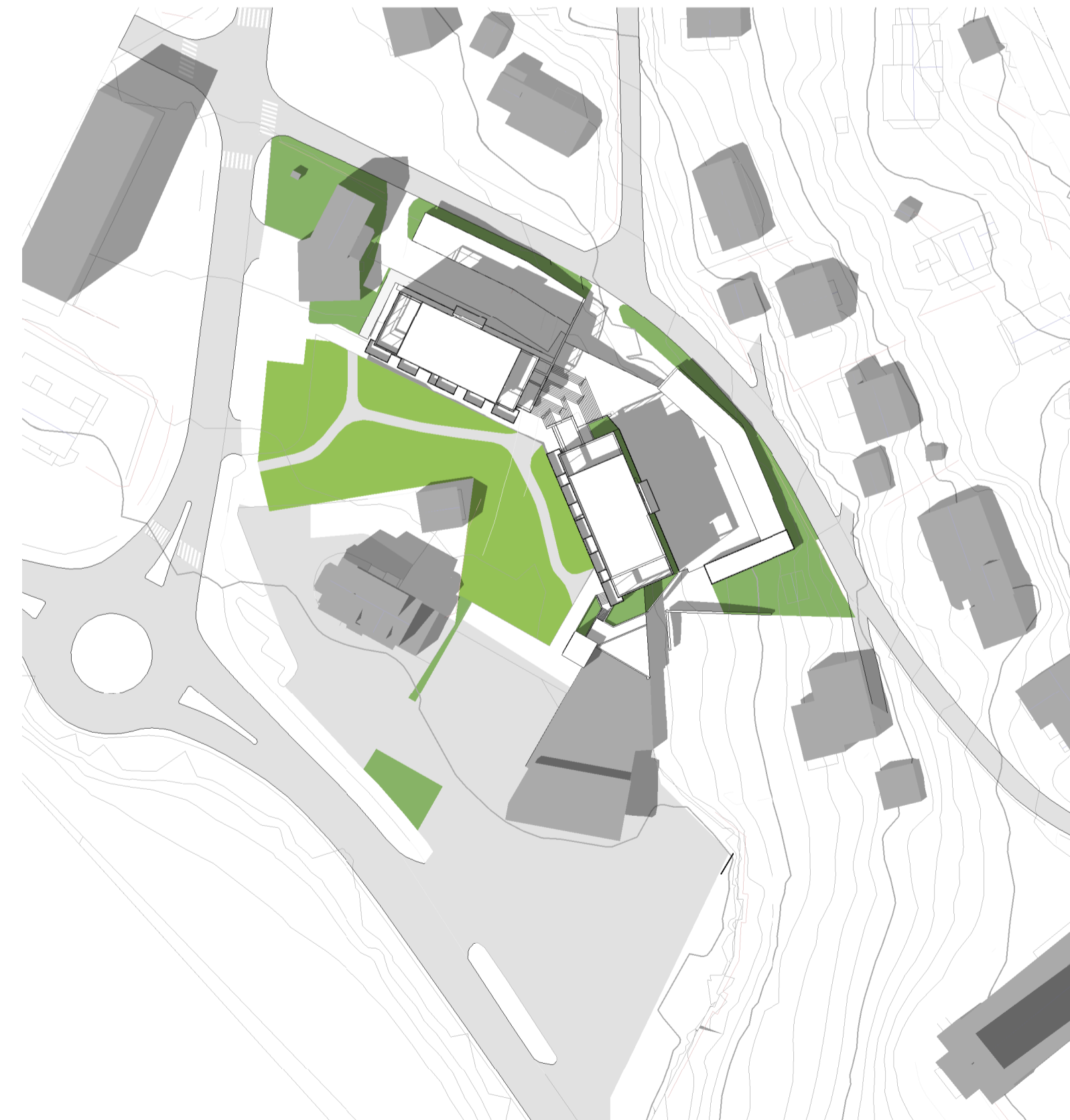
A10_03 - Skyggestudier 01.08. kl15