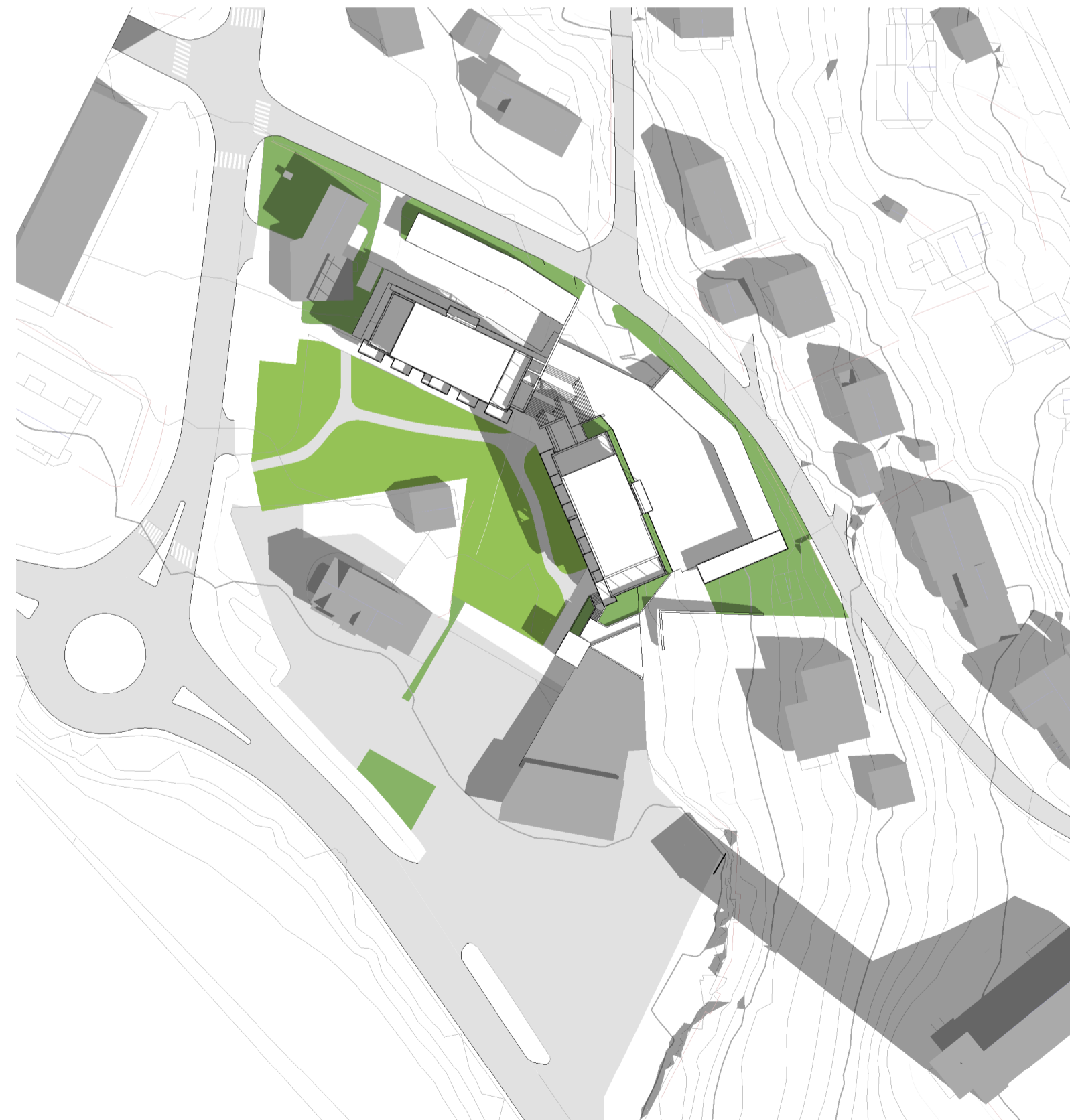
A10_03 - Skyggestudier 01.08. kl09