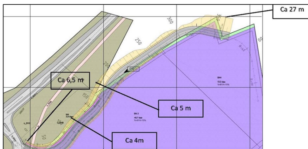
Figur 2 Illustrasjon som viser avvik mellom gjeldende reguleringsplan og foreslått planendring.

I etterkant av innvilget dispensasjon ble det avklart at regulert internvei til næringsområdet ikke vil gi tilfredsstillende adkomst til alle tomtene innenfor området. Det er derfor utarbeidet en ny adkomstløsning som medfører at ny adkomstvei legges i nordøst, på nedsiden av område BN2 og BN4. Som følge av dette må plangrensen utvides noe, og formålsgrensene i området justeres tilsvarende. Regulert internvei SV3 tas ut av planen. Det er også foreslått flere mindre justeringer i plankart og bestemmelser, disse er nærmere omtalt i vedlagt planbeskrivelse, se også tabellen nedenfor.