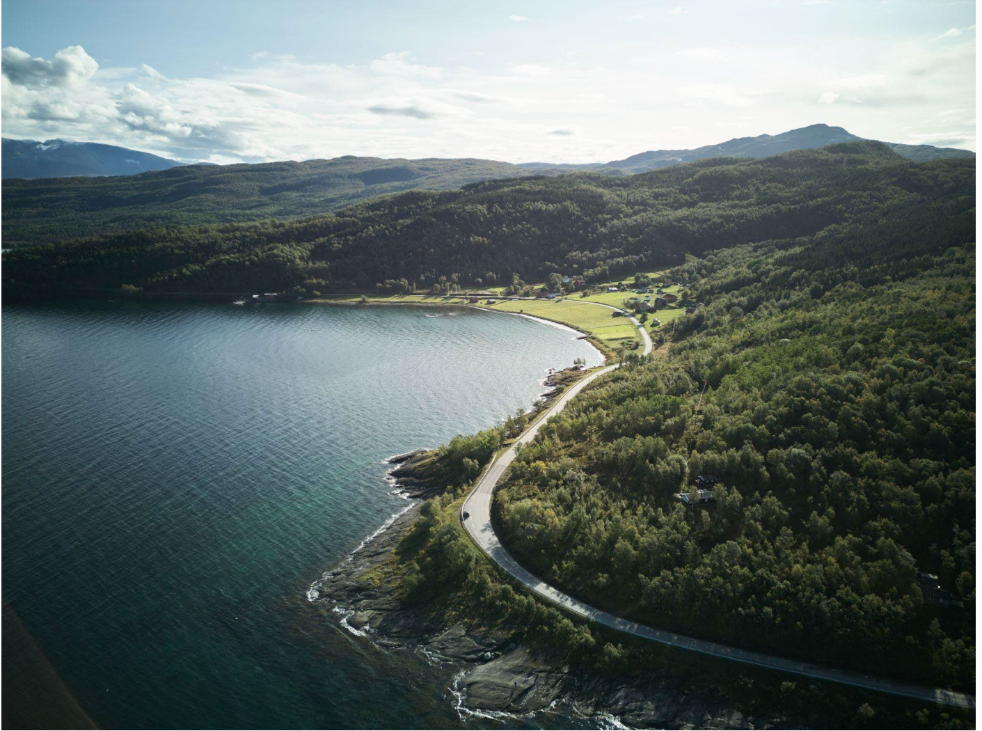
Landbrukets kulturlandskap, Punsvika i Ballangen