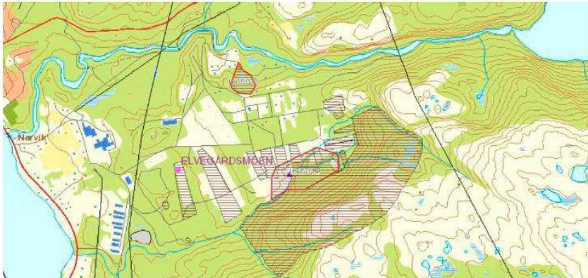
Figur 1: Deponienes omriss markert med skravur og rød linje. Skytebaner og nedslagsfelt/blindgjengerfelt er vist med skravur med sort linje. Deponi 1 i sør, deponi 2 i nord.

Da den daglige driften på skytefeltet ble lagt ned i 1996 ble det foretatt en stor kartlegging av den store fyllingen. Samtidig ble det tinglyst en uråderett som sier at alle arealinngrep i angitte område skal godkjennes av Miljødirektoratet med egen saneringsplan.