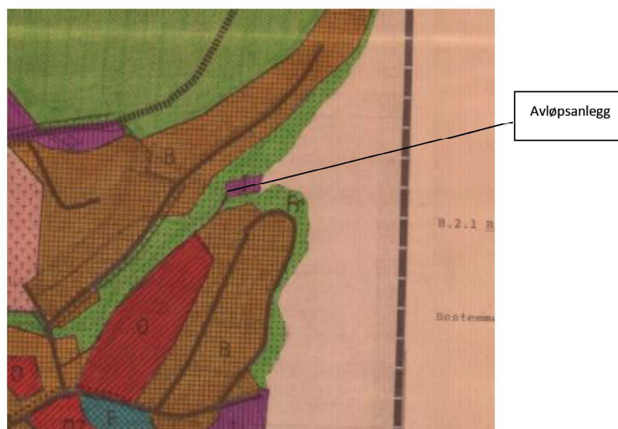
Figur 2: Utsnitt Kommuneplan Tysfjord (Narvik kommune)